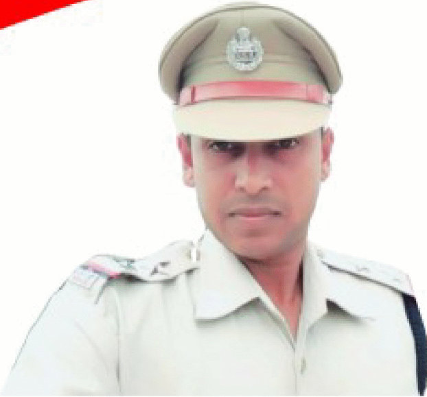
RN Sir (Physical Trainer)